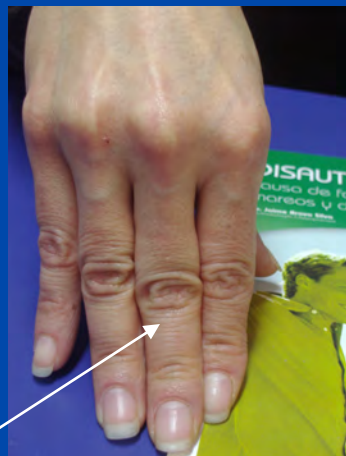
Huella de pata de elefante