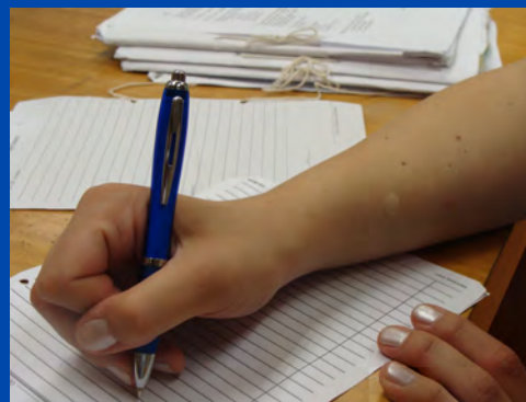
Mano del escribiente laxo