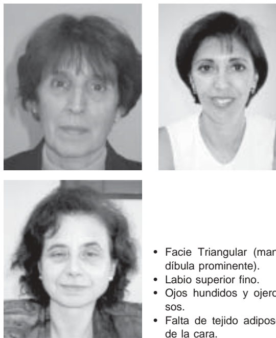
Figura 3. Facie típica del Síndrome de Ehlers-Danlos Vascular (SEDV)